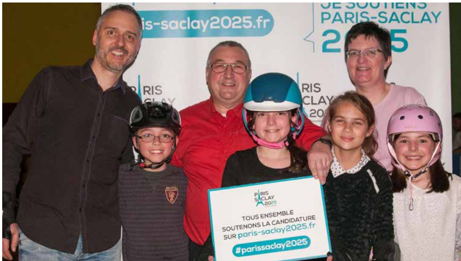
Des Linois soutiennent PARIS SACLAY 2025 (ici lors de la "LINAS ROLLER PARTY" le vendredi 31 mars 2017)